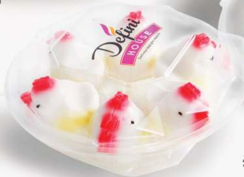
Defini Coconut Gelatin จุ้นเป็ด 6 ตัว / กล่อง ราคา 45 บาท