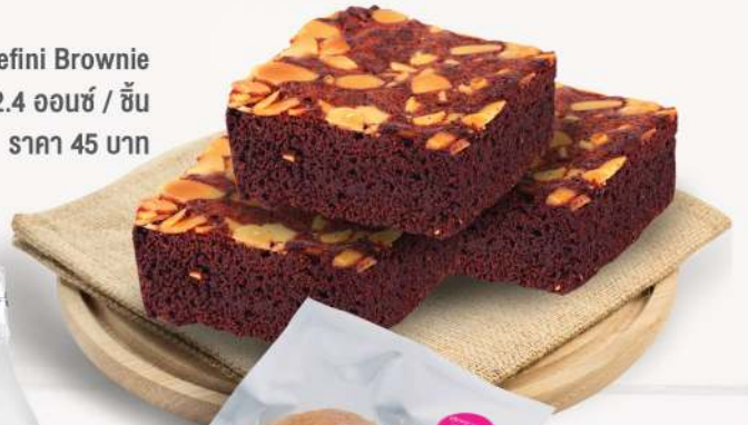
Defini Brownie ปริมาณ 2.4 ออนซ์ / ชิ้น ราคา 45 บาท