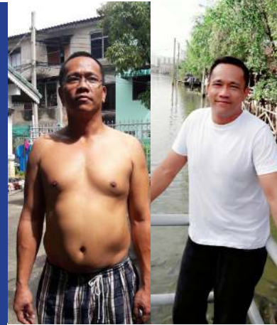
ตุลาคม 2015 89.7 Kg. ธันวาคม 2016 81.4 Kg.