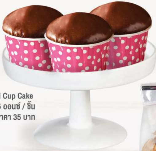
Defini Cup Cake ปริมาณ 2.25 ออนซ์ / ชิ้น ราคา 35 บาท