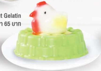
Defini Coconut Gelatin จุ้นไก่ในลำ รราคา 65 บาท