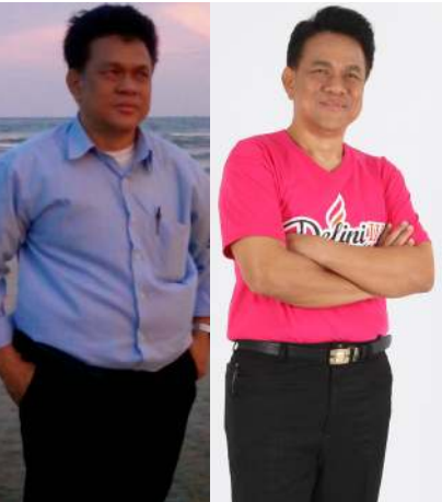
กุมภาพันธ์ 2016 98 Kg.

อายุ 44 ปี อาชีพ ธุรกิจส่วนตัว จังหวัด จันทบุรี