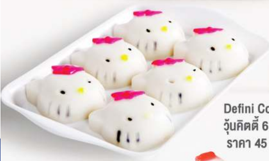
Defini Coconut Gelatin จุ้นคิตตี้ 6 ตัว / กล่อง ราคา 45 บาท